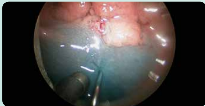
Nella TEM si solleva il piano di resezione tramite l'elevazione della sottomucosa