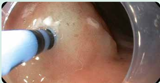
Elevazione della mucosa prima della dissezione endoscopica della sottomucosa (ESD)