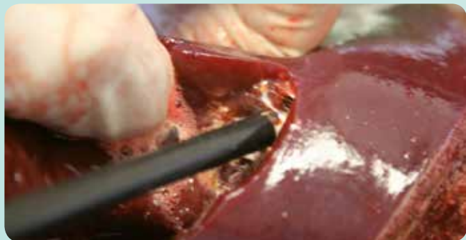
Funzione elettrochirurgica e di idrodissezione integrate in un unico strumento (ad es. per la chirurgia epatica)