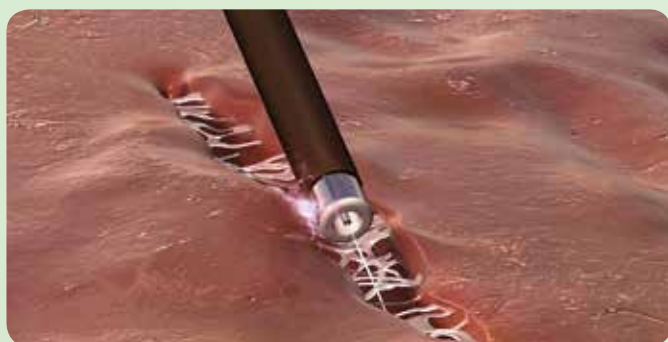
Fig. 1: Dissezione selettiva:

L'idrodissezione, tecnica per dissezione chirurgica utilizzata con successo da diversi anni in medicina, consente di separare le strutture tissutali mediante getto d'acqua in modo selettivo e atraumatico. I vasi sanguigni e le strutture nervose vengono preservati grazie al getto d'acqua a effetto costante e riproducibile. Dopo l'esposizione delle strutture è possibile trattare i vasi a seconda delle loro dimensioni. La precisione del getto d'acqua consente di ottenere l'effetto di elevazione strato selettiva dei diversi piani, evidenziando ed esponendo le diverse strutture anatomiche.