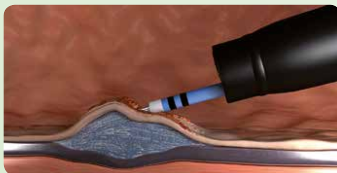
Fig. 2: Elevazione:

L'azione del getto d'acqua espone ed evidenzia i vasi sanguigni che, grazie alla funzione elettrochirurgica combinata dell'applicatore, possono poi essere coagulati e trattati in modo mirato (es. chirurgia epatica).