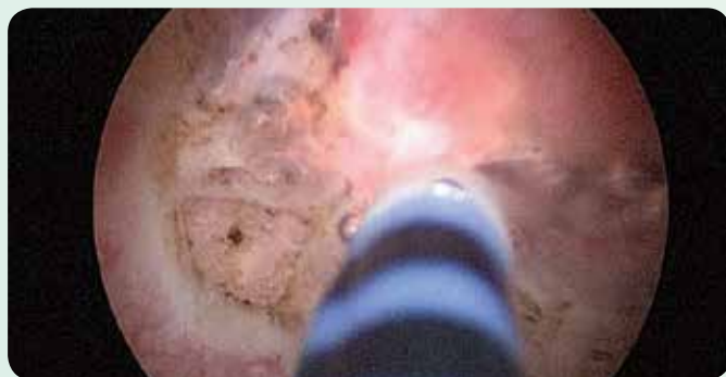
Elevazione prima della resezione di tumore alla vescica