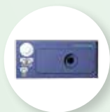
6 mm Elettrodo neutro N° 20140-640