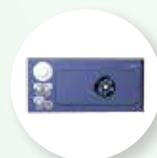
Multifunzione N° 20140-630 (solo VIO 300 D)