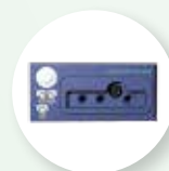
3Pin-9/5 mm, monopolare N° 20140-623