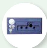
3Pin-Bovie, monopolare N° 20140-622