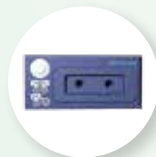
2Pin-22 mm, bipolare N° 20140-612