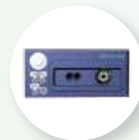
2Pin-22-28-8/4 mm, bipolare N° 20140-613