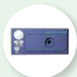
9/5 mm, monopolare N° 20140-620