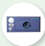
2Pin Elettrodo neutro N° 20140-641