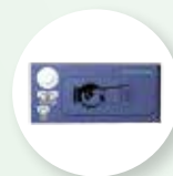
6 mm-2Pin Elettrodo neutro N° 20140-642